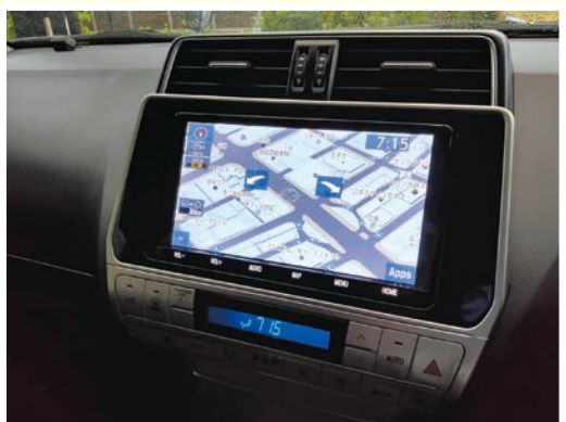
カーナビゲーション