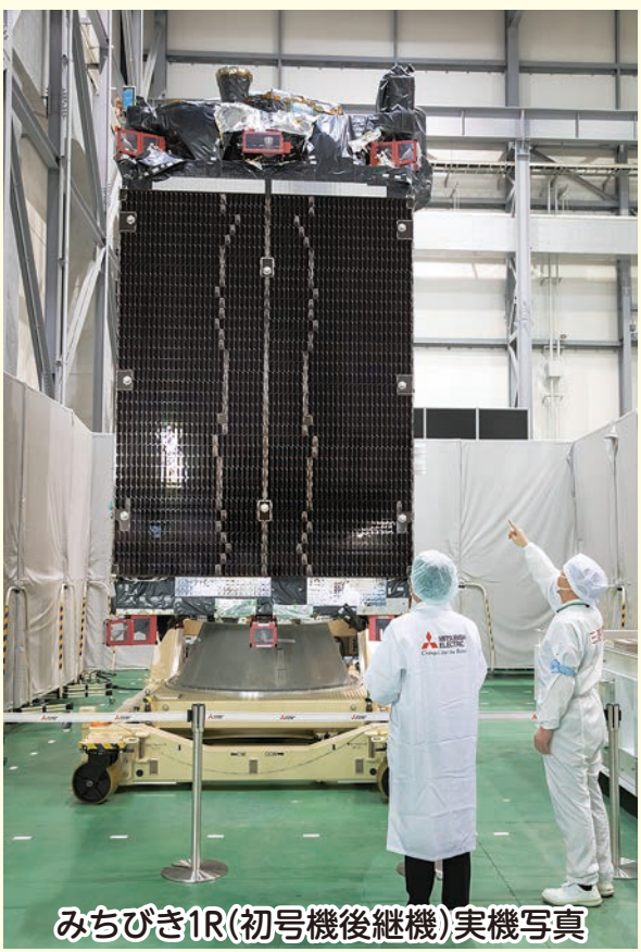
みちびき1R(初号機後継機)実機写真