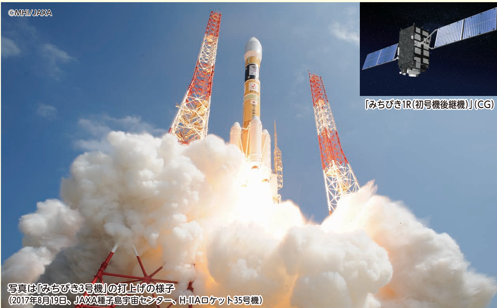
「みちびき1R(初号機後継機)」(CG)